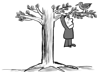
一只站在树上的鸟儿,从来不害怕树枝断裂,因为它相信的不是树枝,而是翅膀。